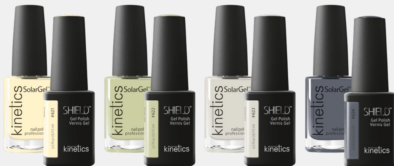
RELIVE RELIVE ME TIME ME TIME UNWIND UNWIND WONDER POWER WONDER POWER #KNP621 #KGP621N #KNP622 #KGP622N #KNP623 #KGP623N #KNP624 #KGP624N SOLARGEL POLISH SHIELD GEL POLISH SOLARGEL POLISH SHIELD GEL POLISH SOLARGEL POLISH SHIELD GEL POLISH SOLARGEL POLISH SHIELD GEL POLISH

TUTTI I COLORI SONO DISPONIBILI IN SOLARGEL E SHIELD GEL POLISH