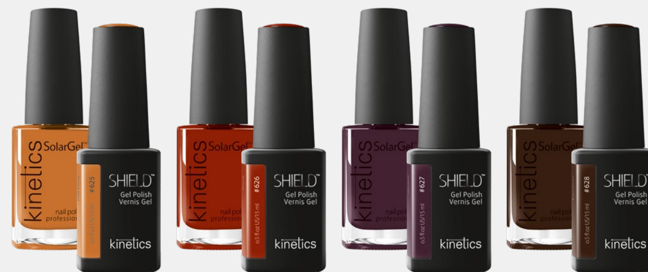
GET COZY GET COZY SNUG SNUG REVEAL REVEAL ESPRESSO ESPRESSO #KNP625 #KGP625N #KNP626 #KGP626N #KNP627 #KGP627N #KNP628 #KGP628N SOLARGEL POLISH SHIELD GEL POLISH SOLARGEL POLISH SHIELD GEL POLISH SOLARGEL POLISH SHIELD GEL POLISH SOLARGEL POLISH SHIELD GEL POLISH